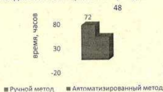
Рисунок 1 – Название рисунка